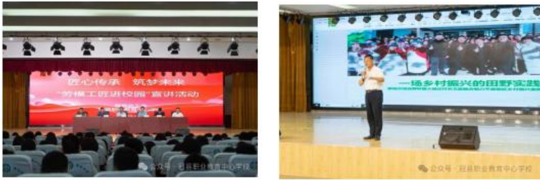
图 6 “劳模工匠进校园” 宣讲活动