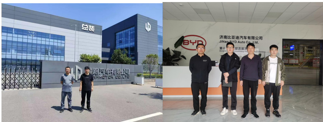
图 20 学校教师下企业调研

制，确保调研工作常态、深入、有效，切实推动人才培养紧密对接产业升级与技术变革需求。将企业实践与调研纳入教师专业发展必修环节，明确周期、时长与任务要求，将调研成果纳入教师绩效考核、职称评聘及评优评先体系，激发教师内生动力。聚焦岗位能力，详细分析目标岗位（群）的典型工作任务、职业能力要求及素养构成，为修订人才培养方案提供实证依据。了解企业对毕业生知识、技能、职业态度等方面的真实反馈与长期发展评价，诊断人才培养质量。