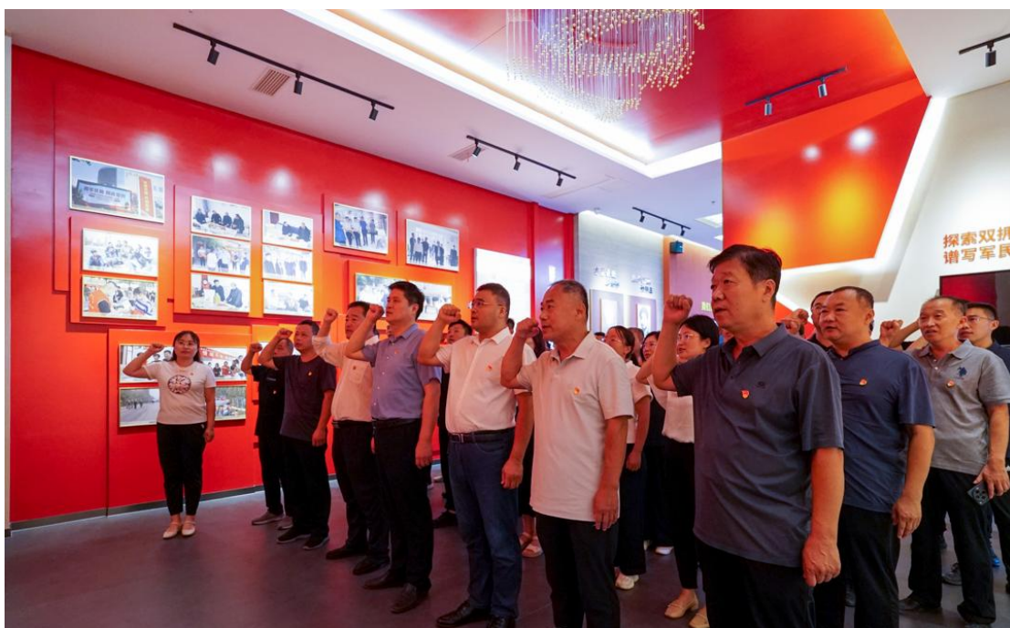
图 29 校党委开展重温入党誓词活动