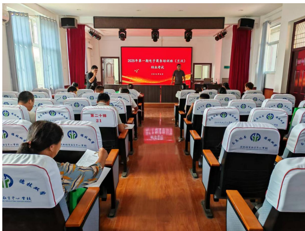
图 19 学校开展送技下乡活动

这两期“送教到乡”的培训，精准对接了乡镇产业发展与居民就业需求，是学校服务地方、赋能基层的生动实践，为助力乡村振兴和县域劳动力技能提升贡献了积极力量。