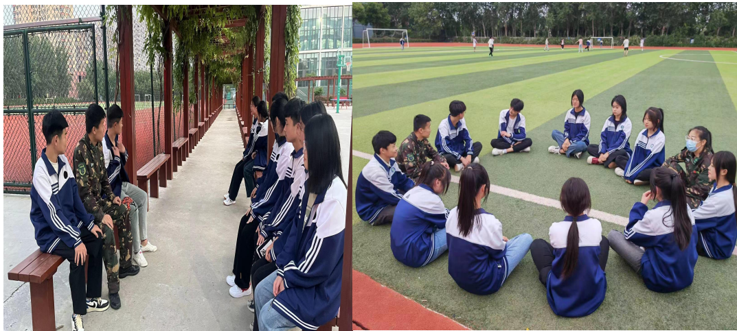
图 7 军事化管理

学校着力打造校领导带头、中层领导组织、基层班主任实施、全校教师及驻校教官参与的育人团队，在学习、生活、健康、安全、网络等多个场域开展育人活动。学校实行军事化管理，构建了“制度规范，公平公正”的军事化管理制度体系模式，促进学生自觉养成遵规守纪、文明交往、吃苦耐劳、拼搏进取的良好品德。