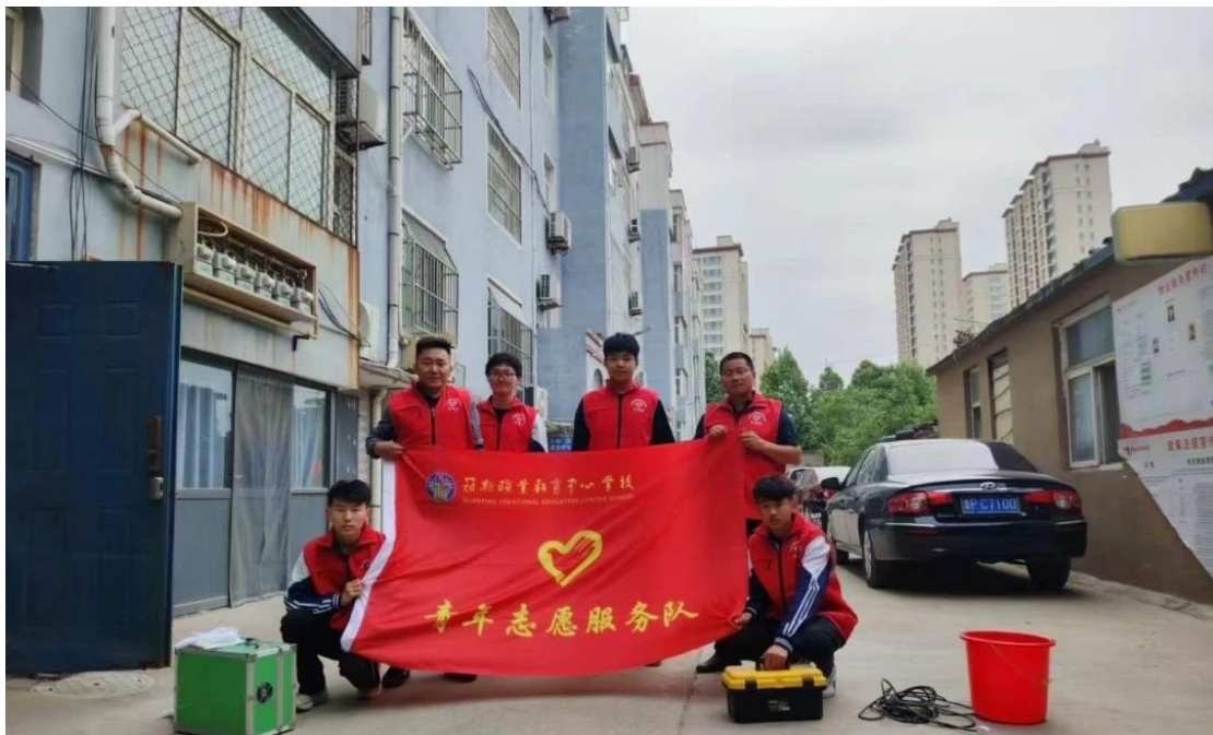
图 24 学生在社群开展志愿活动

协作与沟通、坚韧与乐观，在生动的社会实践中深刻理解并践行着社会主义核心价值观与中华优秀传统文化。