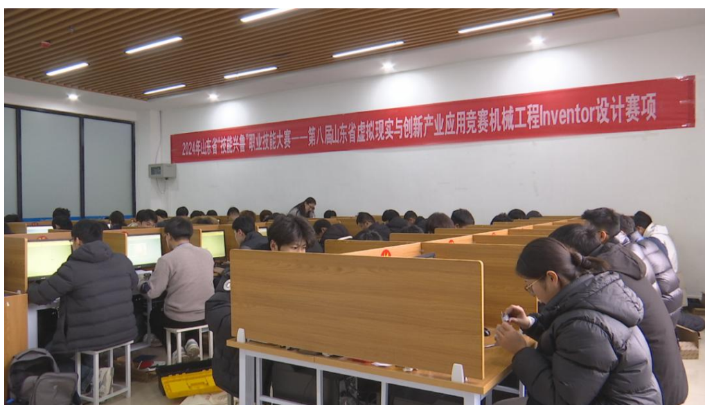
图 17 学校举行“技能兴鲁”技能比赛

12月10日，学校举行山东省“技能兴鲁”职业技能大赛——第八届山东省虚拟现实与创新产业应用竞赛机械工程 Inventor 设计赛项，来自全省42家职业院校的100余名选手参加了比赛。此次竞赛内容从机械装配图和零件图的制作、给定零部件的逆向工程设计及职业素养等方面考察参赛选手的相关技能。整场比赛紧张而有序，参赛选手认真答题，严谨操作，熟练运用三维工程工业设计软件对零件进行建模，展现出了良好的精神风貌和精湛的技术水平。