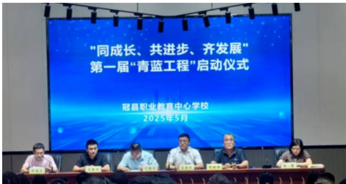
图 30 “青蓝工程”启动仪式

形成了“国家级-省级-校级”三级培训联动、“线上+线下”“集中学习+企业实践”多种形式互补的培训格局，覆盖了班主任、思政教师、专业课教师、备考教师等不同群体，满足了教师多样化、个性化的专业发展需求。