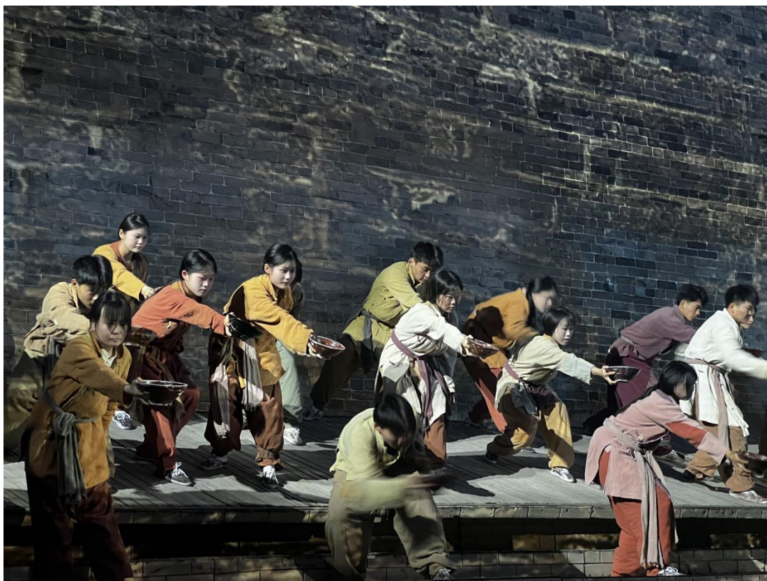
图 28 舞蹈表演专业学生实习照片