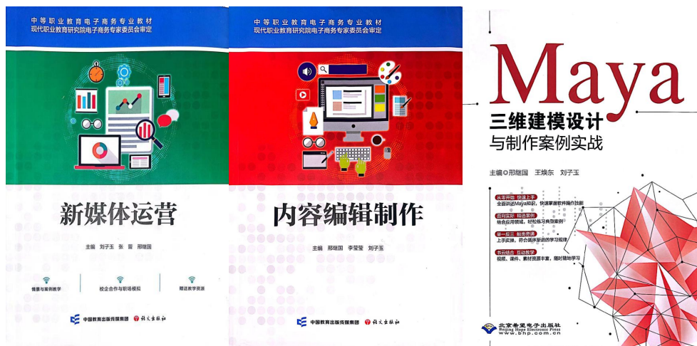
图 16 学校开发的校本教材