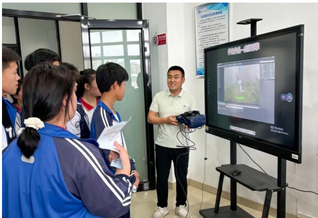
图 18 学校开展职业体验活动

实（VR）体验区，学生们戴上 VR 设备，感受科技带来的奇妙体验。数媒智作中心体验区，通过前沿技术设备与场景化设计，直观呈现数字媒体技术的应用成果。护理体验活动的学生们在专业教师的指导下化身白衣天使，学习胸外按压，模拟心肺复苏过程。汽修专业体验区，同学们对汽车的结构产生了浓厚的兴趣，个别同学对专业教师问了几个自己家汽车上的几个故障原因，专业教师对故障一一作了分析回答。在活动过程中，学校还邀请了部分企业代表走进校园，与学生们进行面对面交流。学校开展的职业体验活动非常有意义，让学生们提前接触到了职业环境，为今后的职业发展打下了良好的基础。