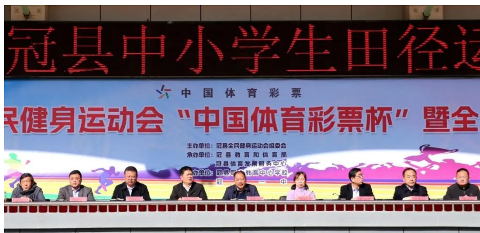
图4 学校举办县级田径运动会

学校择优选拔有特长、有潜质的学生，组建各类项目校队，进行系统训练，培养体育骨干。鼓励并组织学生参加市、省乃至全国的中等职业学校体育比赛、青少年体育锦标赛等。3月县运动会，我校学生勇夺团体第三名；同月市体育联赛女子篮球赛，女篮获第六名。4月市体育联赛田径比赛中，斩获团体第二名。在市学生田径运动会中，学生获第一名3人次，第二名11人次，第三名6人次，第四名8人次，第五名4人次，第六名1人次，第七名6人次，第八名4人次。获得市学生女子篮球赛第五名、男子篮球赛第七名的成绩。市乒乓球比赛中，勇夺团体第三名和第四名，获得单打第一名、第三名、第四名、第六名、第七名各1人次。市羽毛球比赛中学生取得第四名、第七名的成绩。