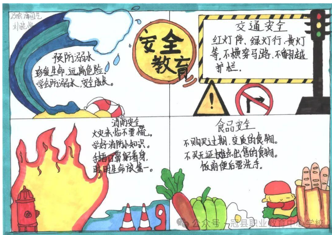
图 13 安全主题手抄报

报创作中。他们精心设计版面，巧妙运用文字与图案，或用生动的漫画讲述安全小故事，或用醒目的标语传递安全警示，一份份主题鲜明、内容丰富、设计精美的手抄报，不仅展现了同学们扎实的绘画功底和创新能力，更体现了他们对安全问题的深刻理解和重视。作品收集完成后，我校美术组老师组成专业评审团，从主题内容、版面设计、艺术创意、书写规范等多个维度，对所有手抄报进行了认真、细致的评选。经过层层筛选，最终评选出一等奖 20 份、二等奖 27 份、三等奖 7 份、参与奖 8 份。