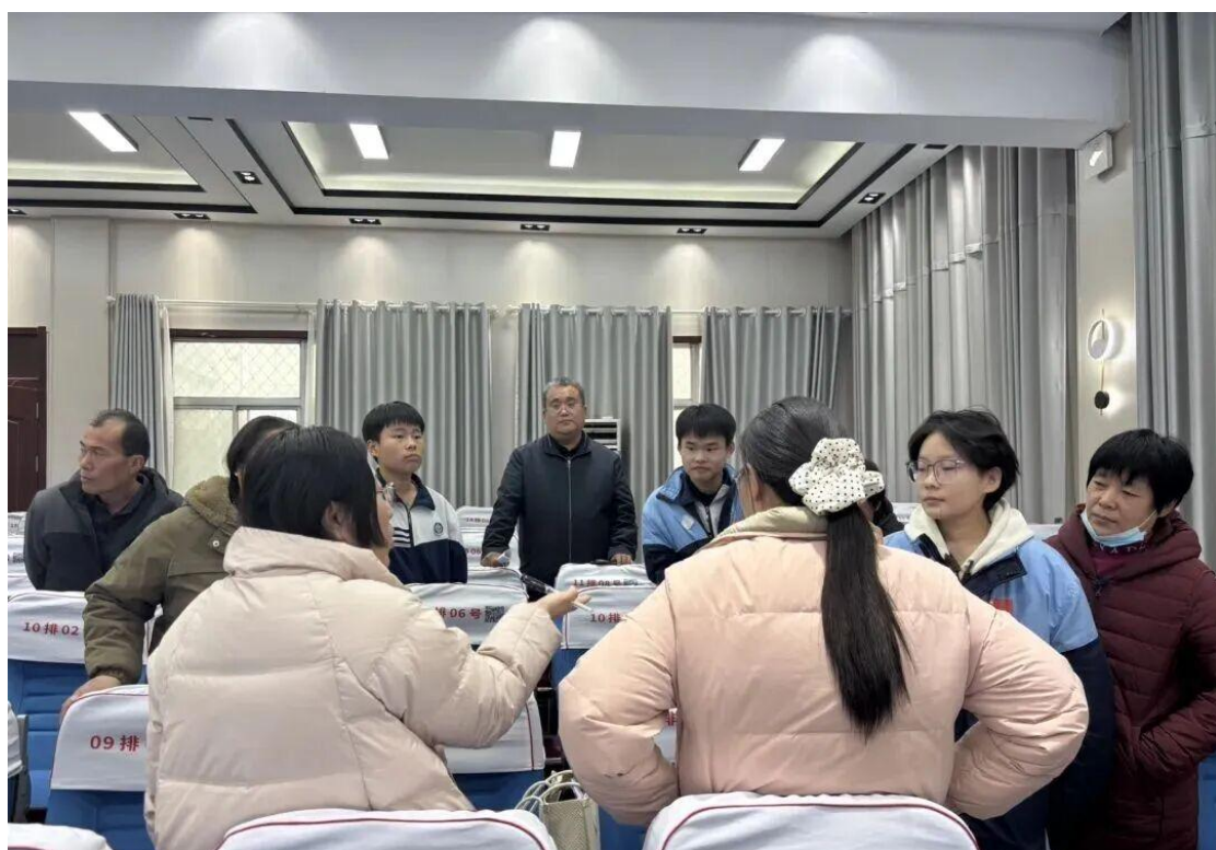
图9 家校共育交流活动现场

能在“舍得”中，陪伴孩子稳步前行，让孩子在父母的用心呵护下健康成长。座谈会尾声的15分钟分组交流环节，家长们结合孩子实际情况，与班主任及任课教师深入沟通个性化问题，现场互动热烈。此次座谈会搭建了高效的家校沟通桥梁，让双方对冲刺阶段的目标更清晰、方向更明确。高考之路，家校同心则行稳致远。相信在此次座谈会的推动下，家校将形成更强育人合力，助力高三学子以最佳状态迎战高考，圆梦理想院校！