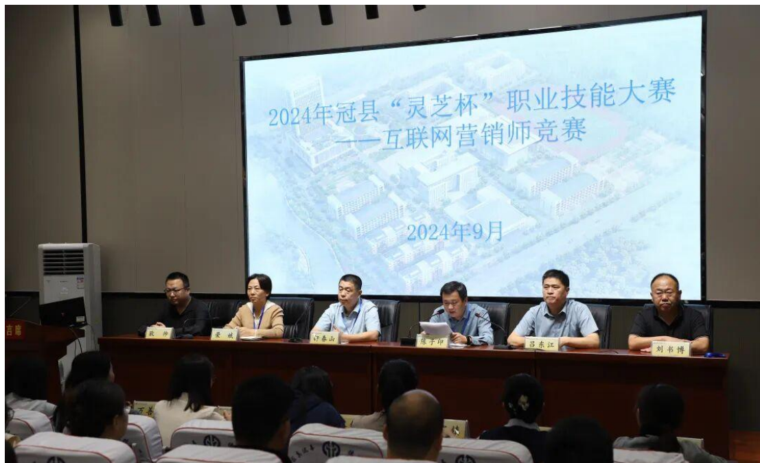
图 21 “灵芝杯”互联网营销师竞赛

的飞跃，更促进了行业经验的广泛传播与深度融合。学校为比赛提供了专业、细致、周到的服务，保障了赛事的顺利举行，受到参赛师生和大赛组委会的充分肯定。在今后的发展中，学校将以实际行动为加快培养乡村振兴领域技能人才队伍助力，以技能提升推动乡村振兴，为冠县乡村振兴和技能人才队伍建设贡献重要力量。