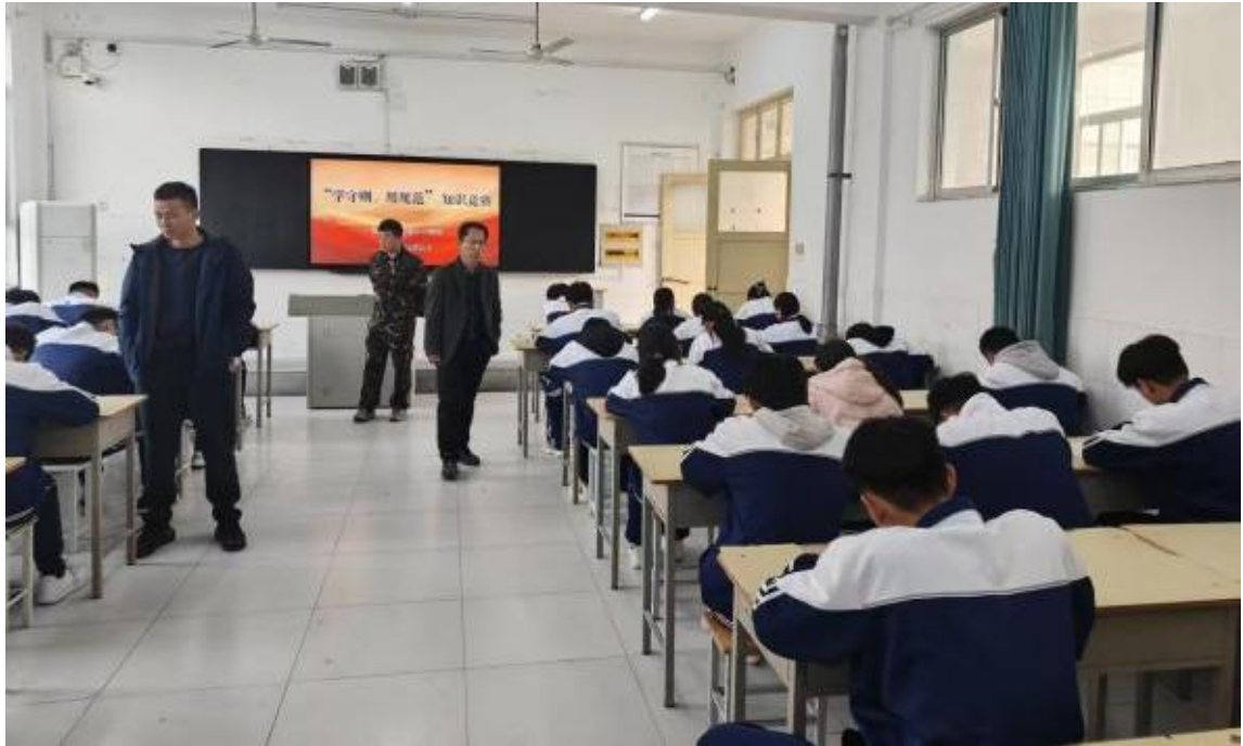
图 11 学生参与“学规范 用规范”竞赛活动