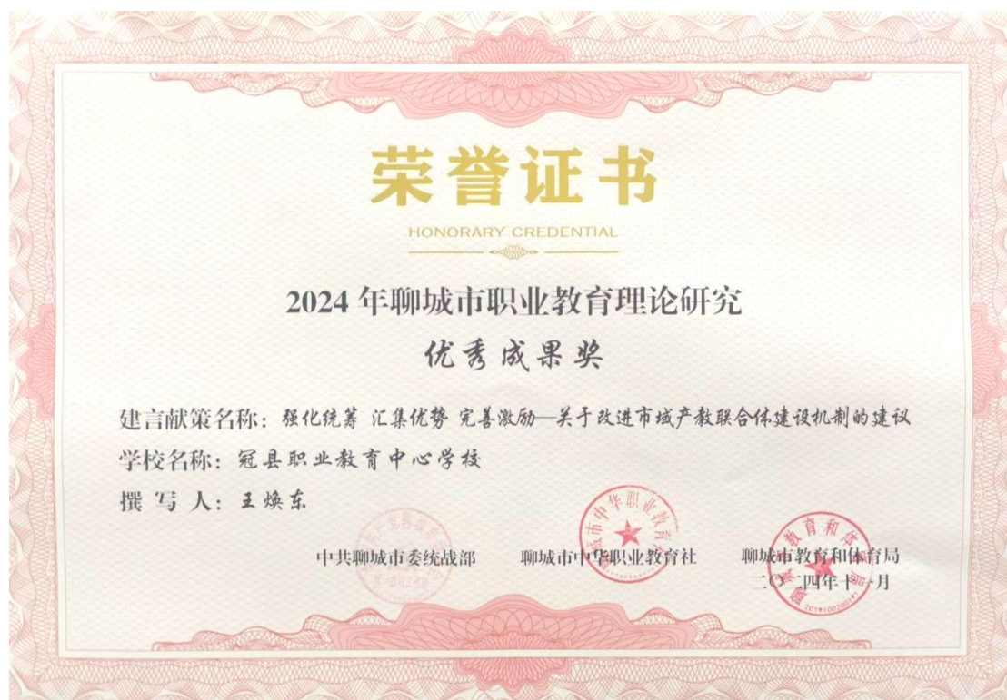
图 26 市级职业教育理论研究优秀成果

由市教体局牵头，系统开展市级产教联合体的遴选建设工作，在市政工作体系内规划职业教育的发展路径。制定以“产教融合型企业”培育为主线的“金融+财政+土地+信用”组合式产教融合激励细则，让企业经营与技能人才培养找到更多利益交集。