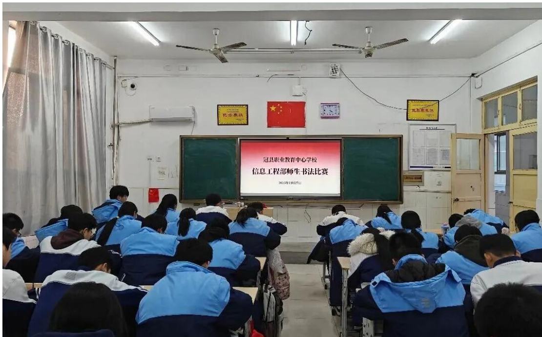
图 22 书法比赛现场

优秀奖 90 名。2025 年 4 月举办教师硬笔书法比赛，全校教师踊跃参与，在笔墨间展现师者风采。