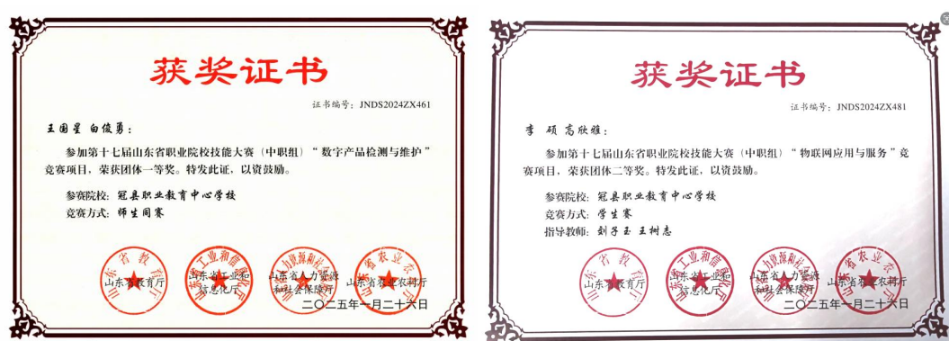
图3 技能大赛获奖证书

2024年12月，开展学生中级职业技能等级认定工作。认定的工种和人数为电工139人、汽车维修工53人、养老护理员100人、保育师60、电子商务师92人，合计444人。2025年6月，组织学生开展网络安全管理员中级等级认定工作，共计111名学生参加认定。