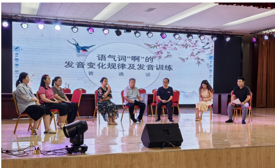
图 14 校级教研活动

划、事中监控、事后评价”的教学质量监控体系。每学期初对教师教学计划执行情况、课堂教学质量、教学规范落实情况、实践教学指导效果等进行全程监控与考核，确保教学工作规范有序开展。改革学生学业评价方式，推行过程性评价与多元化评价相结合的模式，将学生的课堂表现、作业完成质量、项目实践成果、技能考核成绩、职业素养表现等纳入综合评价体系，全面、客观地反映学生的学习成效与能力水平。同时，引入企业评价维度，邀请合作企业对学生的实习表现、岗位适配度进行评价，使评价结果更贴合职业岗位需求，有效激发了学生的学习积极性与主动性。