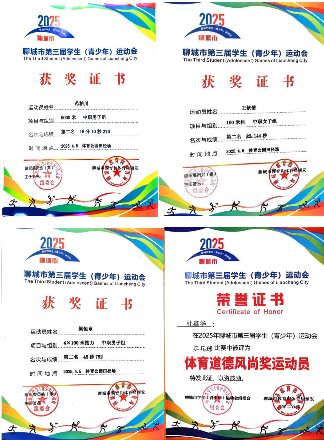
图 5 学生在市运动会中获奖