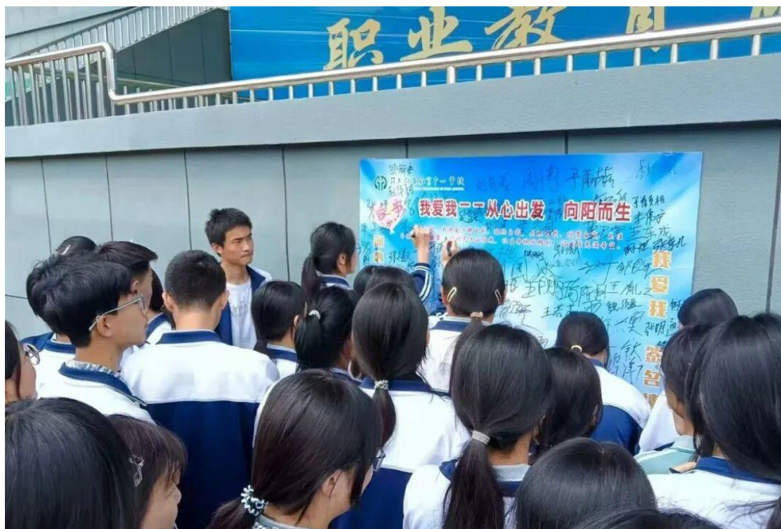
图 10 学生参与心理健康教育月活动

心理健康月一系列活动的召开,有助于塑造学生健全的人格,指导学生从正视自我、增强信心。普及了心理健康必备素质和心理健康的标准,分析了中职生常见心理问题,指导学生如何积极维护中职生心理健康等。帮助同学们了解到较为丰富的心理健康知识,树立了心理健康意识,形成了人人关注自身心理健康的良好氛围。