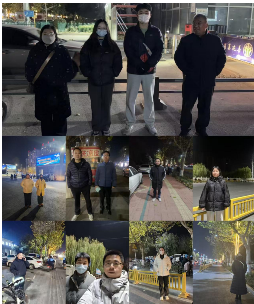
图 12 学校安全值班照片

园欺凌、网络安全、疾病的预防与控制、防火安全、防溺水安全、安全用电、交通安全、禁毒教育等系列主题班会。