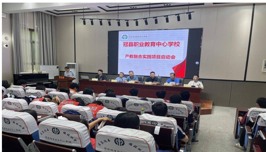
图 27 校内实训项目启动会

在 2025 年度，共安排 183 名学生参加美团校内实训项目，47 名学生参加京东校内实训项目，均以优异成绩顺利完成实训项目,其中 99 名优秀，119 名良好，11 名合格。学生的专业技能得到提升、团队协作和沟通能力增强、社会适应能力提高。